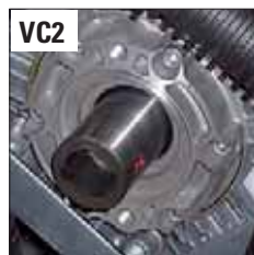
ANT. - FRONT - ПЕР.