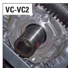
POST. - REAR - ЗАД.