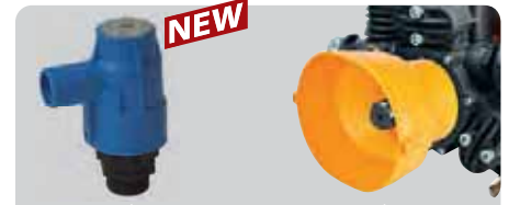
DISPOSITIVI DI SICUREZZA SAFETY ACCESSORIES