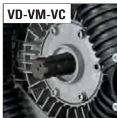
ANT. - FRONT - ПЕР.