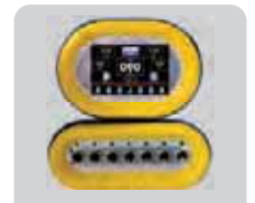
COMPUTER E PANNELLI COMPUTERS AND SPRAYERS CONTROL