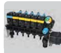
GRUPPI DI COMANDO CONTROL UNITS