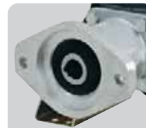
ACCESSORI D'AZIONAMENTO DRIVE ACCESSORIES