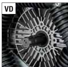
POST. - REAR - ЗАД.