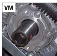
POST. - REAR - ЗАД.